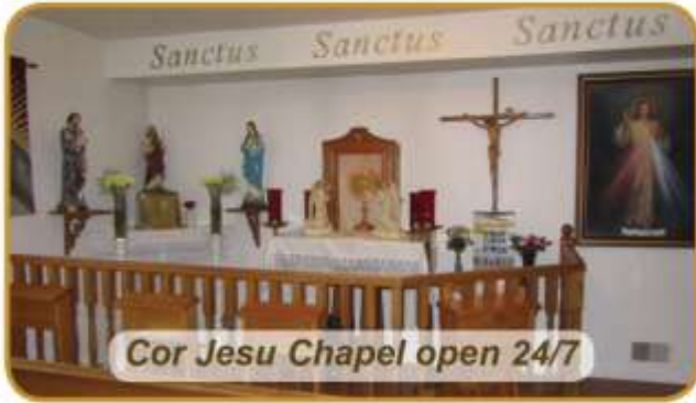
Cor Jesu Chapel open 24/7

Please support our Advertisers! Veuillez encourager nos commanditaires!