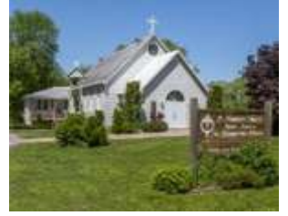
"La Paroisse avec Coeur"